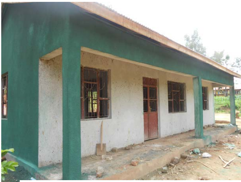
Projekt Kindergarten. I dag står huset på plats, nästan färdigt.